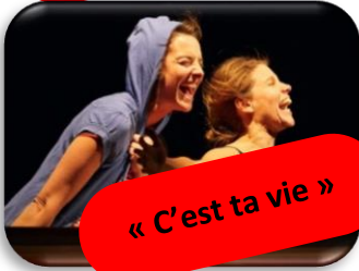
« C'est ta vie »