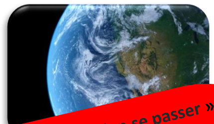
« La fin du monde va bien se passer »