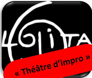
« Théâtre d'impro »