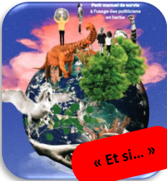
« Et si... »