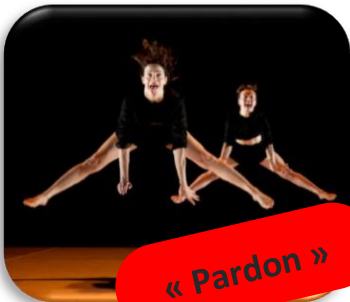
« Pardon »