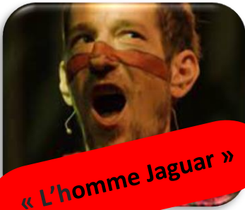
« L'homme Jaguar »