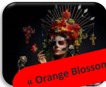
« Orange Blossom »